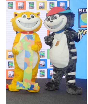
Website and social media platforms. (19-8)

Adding to the festive cheers, the kids are in for a treat as not only will their favourite toons dance their hearts out, but they shall also stand a chance to participate in exciting games, activities and win some amazing gifts. Here's a chance to take a selfie with your favourite Honey - Bunny and have your celeb moment with the picture being uploaded on SONY YAY!