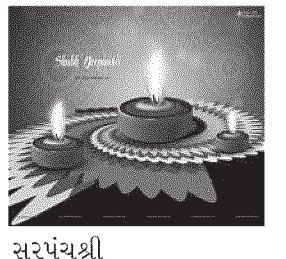
પોર ગ્રામ પંચાયત,પાદરા મુકામઃ પોર પોસ્ટ જી.વડોદરા

કરનાર તથા કરાવનાર બન્ને કાનૂની અપરાધી છે.(૩) દીકરીના દન્મ નો ઉત્સવ મનાવીએ.દિકરીને ઉચ્ચ શિક્ષણ આપી સ્ત્રી સશકિતકરણ વેગવાન બનાવી એ.(૪) જન્મ મરણ નોંઘણી તથા લગ્ન નોંઘણી અતિ આનશ્યક બાબત છે. સમય મર્યાદામાં કરાવી કાનુની ગુંચમાંથી બચીએ.(પ) ગ્રામ સભા એ સામાજીક ઓડીટ છે.એક આર્દશ નાગરીક તરીકે ગ્રામસભામાં હાજરી આપી ગામના પ્રશ્નોનો નિકાલ કરીએ.(૬) જે ગામને હોય ગંદકી-ઉકરડાથી વેર. તે ગામમાં હોય લીલા લહેર,ઘરમાં કચરા પેટી રાખવી અતિ આવશ્યક છે.(૭)જયાં વૃક્ષોની અમી છે.ત્યાં શેની કમી છે વૃક્ષો વાવો,વરસાદ લાવો.(૮) પંચાયતના વેરા તથા જમીન મહેસુલ એ સરકારી કર્જ છે તે સમયસર ભરી કર્જમુકત બની.(૯) ટપંક સિંચાય એ શ્રેષ્ઠ સિંચાય પધ્ધતિ છે.ટપક સિંચાઈ અપનાવી.સરકારશ્રી દ્રારા અપાતા અનુદાન મેળવીએ.(૧૦) ૦થી૦.૫ વર્ષના તમામ બાળકોને સરકારશ્રી દ્રારા અપાતી રોગપ્રતિકારક રસીઓઆપાવીએ.(૧૧)હંમેશા હેલ્મેટ તથા સીટ બેલ્ટનો ઉપયોગ કરીએ. તથા ડ્રાયવીંગ સાથે દારૂના ભળવીએ.